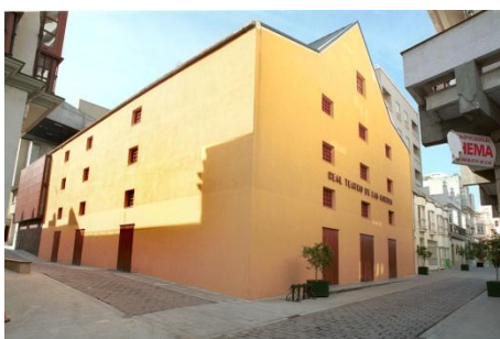
Real Teatro de Las Cortes

C/ Real, 83 11100 SAN FERNANDO (Cádiz) Teléfono: 956 003 901/2 E-mail: centrodecongresos@aytosanfernando.org