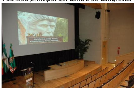
Auditorio Lázaro Dou

En el corazón de San Fernando y conectado con el núcleo patrimonial y cultural de la ciudad, se encuentra el Centro de Congresos y Exposiciones “Cortes de la Real Isla de León” . Unas confortables y modernas instalaciones levantadas sobre el edificio del antiguo cine Almirante que fue diseñado en la década de los 40 del siglo XX por Antonio Sánchez Estévez, considerado uno de los principales arquitectos racionalistas andaluces.