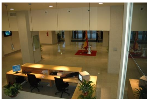
Recepción del Centro de Congresos