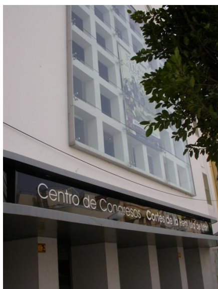
Fachada principal del Centro de Congresos